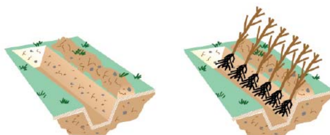
1. ouvrir un 1 er sillon