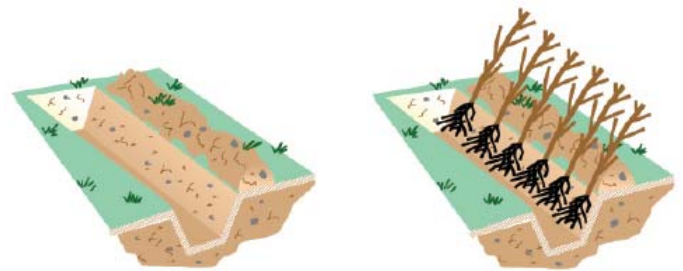
1. ouvrir un 1 er sillon